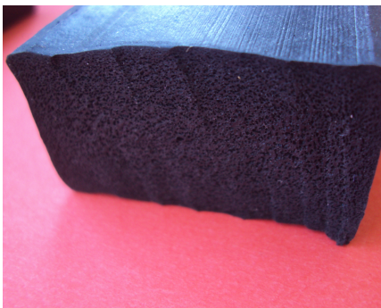
Пористый шнур квадратного или прямоугольного сечения