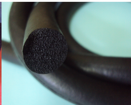
Шнур пористый круглый диаметр от 3мм