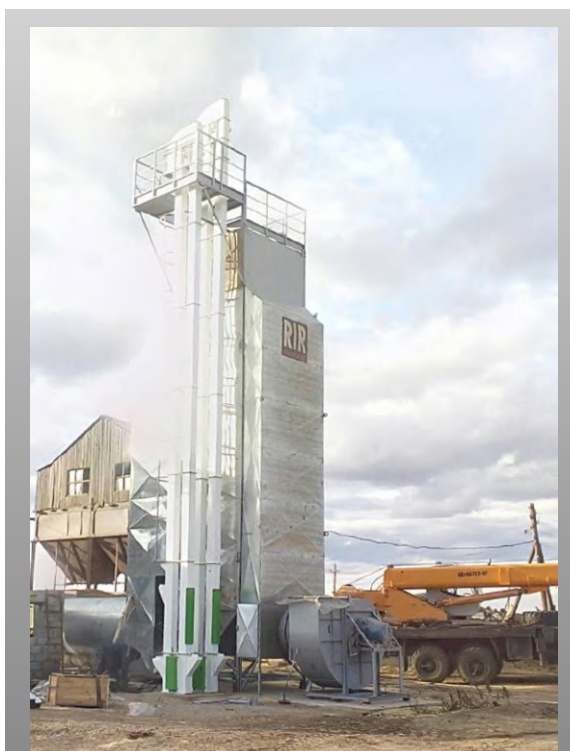
RIR-15C техническая производительность 15т/час

УНИВЕРСАЛЬНОСТЬ качественная сушка монокультур различного назначения